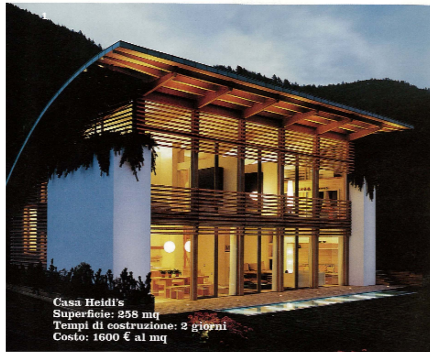
Casa Heidi's Superficie: 258 mq Tempi di costruzione: 2 giorni Costo: 1600 € al mq