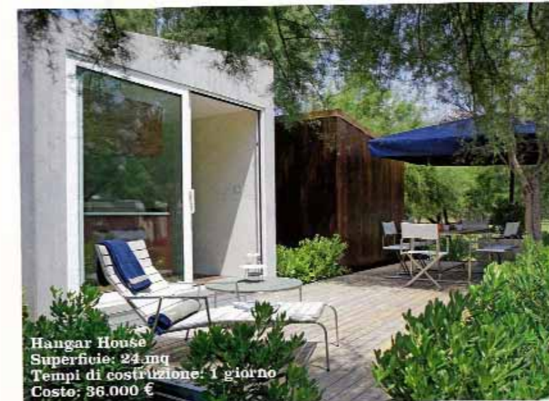
Hangar House Superficie: 24 mq Tempi di costruzione: 1 giorno Costo: 36.000 €